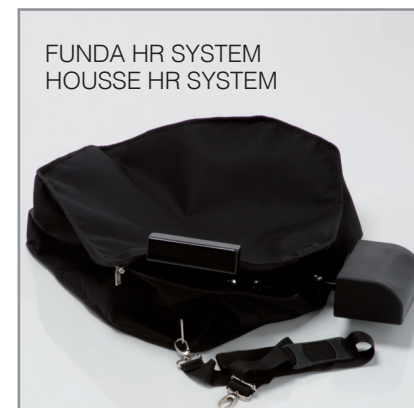
FUNDA HR SYSTEM HOUSSE HR SYSTEM